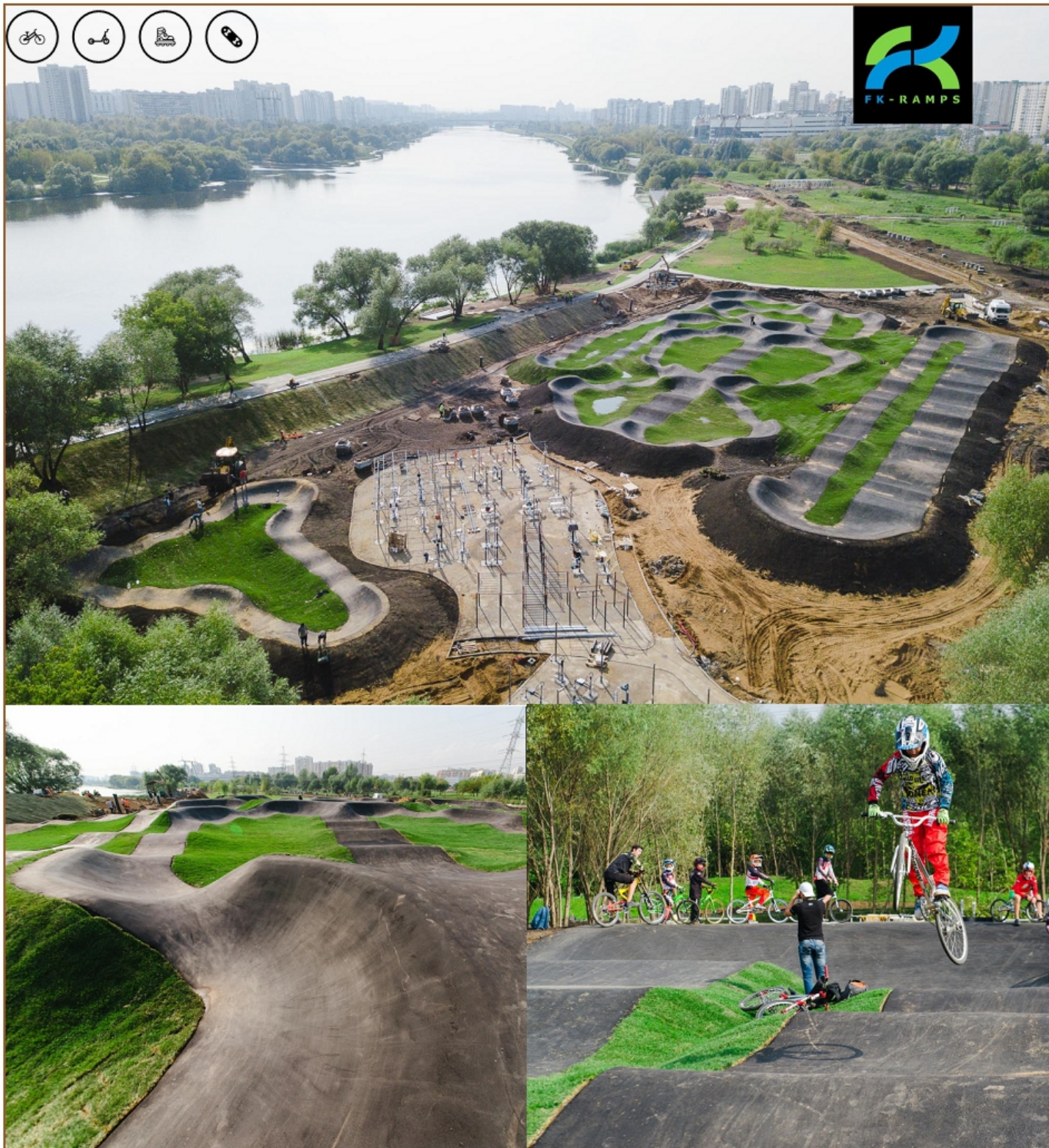
ФОТО РЕАЛИЗОВАННОГО ОБЪЕКТА

Парк 850-ти летия г. Москвы, р-н Марьино, г. Москва